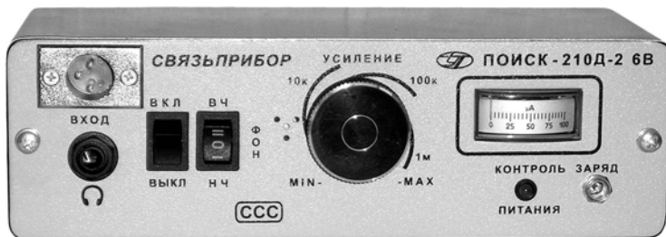
Рис.1. Общий вид прибора.