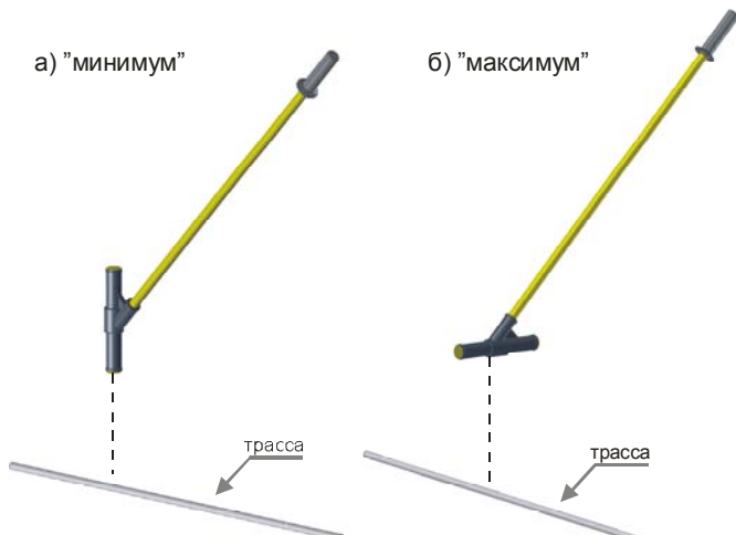
Рис 4. Положение антенны над трассой при поиске по «минимуму»- а), и по «максимуму» - б).